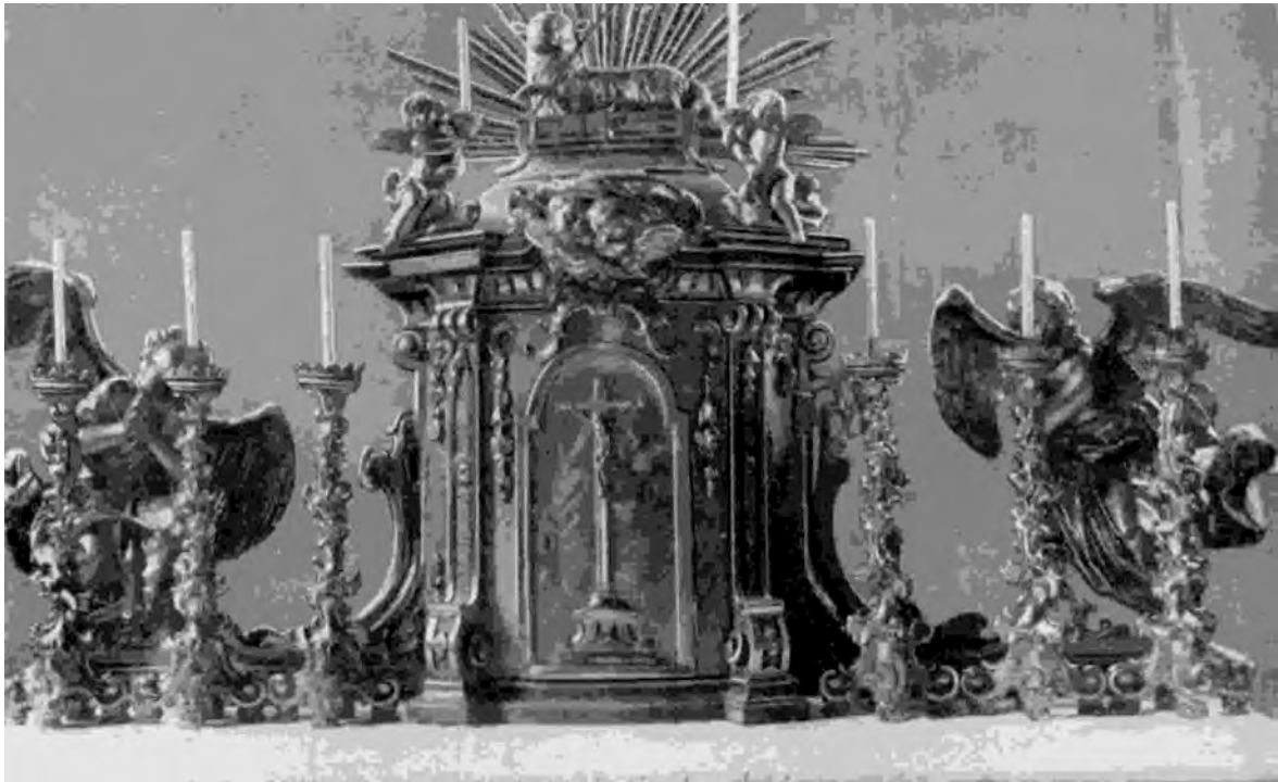
Abb. 8: Hochaltar der Pfarrkirche

Der erstere und der letztere wurden überdies während der ganzen Arbeitszeit vom Pfarrer verköstigt. - Auch das Altarbild, darstellend den hl. Ägidius, wurde damals vom fürstlichen Hofmaler in Feldsberg neugemalt; leider mußte es im Jahre 1811 schon wieder renoviert und im Jahre 1856 vollständig entfernt werden.