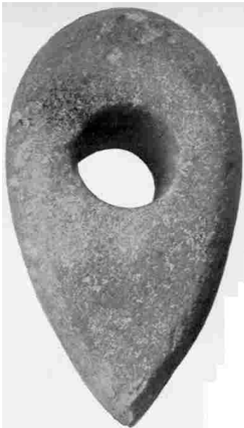
Abb. 2: Beil (aus Grünstein) aus der jüngeren Steinzeit

die immer mehr wertvolles Material zur Urgeschichte von Bernhardsthal brachte, die ihm selber immer mehr zur Freude wurde und für die ihm schließlich nicht bloß seine Pfarrgemeinde, sondern auch die prähistorische Wissenschaft in Österreich immer zu Dank verpflichtet bleibt.