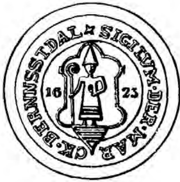
Abb. 7: Das alte Marktsiegel

Daß die Pfarre und die Ortsgemeinde den Namen Bernhardsthal auf den hl. Bernhard zurückführten und ihn als Schutzpatron verehrten, ist begreiflich. In Wirklichkeit hat St. Bernhard mit der Entstehung des Ortes keinen Zusammenhang, auch wenn in manchen historischen Werken die Auffassung der Ortsbewohner mehr oder minder zum Ausdruck kommt. Als der hl. Bernhard von Clairvaux geboren wurde (1090), gab es bereits ein Bernhardsthal, und bevor er noch (1170) heiliggesprochen wurde, hatte der Ort auch schon seine Kirche zu Ehren des fränkischen Heiligen Ägidius 81 . Wenn man „die Sage“ erzählen läßt, daß an Stelle der heutigen Kirche ein kleines Kirchlein zu Ehren des hl. Bernhard gestanden sei, so greift die Sage eben stark daneben.