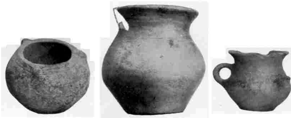
Abb. 3: Gefäße aus der Bronzezeit