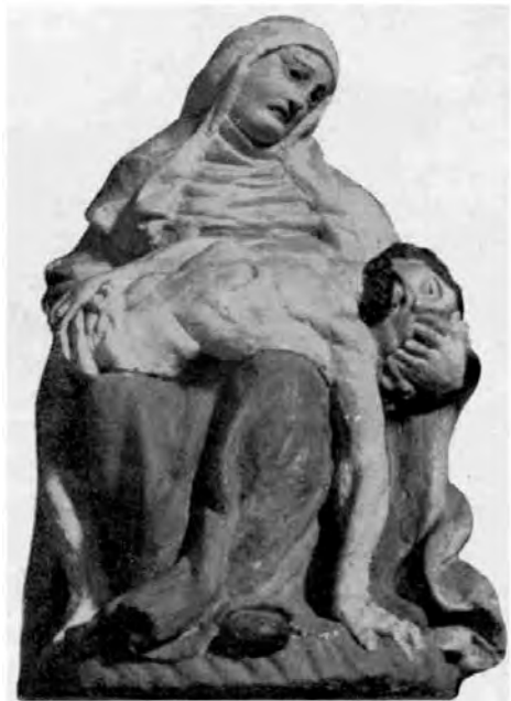
Abb. 10: Statue der Schmerzhaften Muttergottes (am Marienaltar der Pfarrkirche)