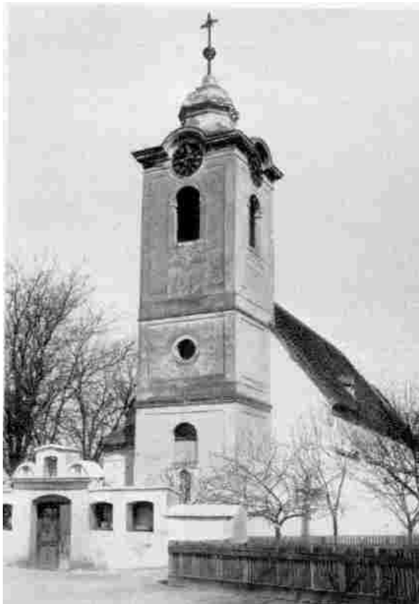
Abb. 9: Turm der Pfarrkirche

Mit der Aufstellung des zweiten Seitenaltars war im Innern der Kirche das Wichtigste geschehen. Nun konnte Pfarrer Heindl darangehen, dem ganzen Äußeren der Kirche ein anderes Aussehen zu geben. Der Dachreiter, sicherlich nicht ganz klein, weil er ja vier Glocken tagen konnte, aber gerade darum zu schwer für den Gewölbebogen, auf dem er saß; dazu das graue, nach jeder Reparatur fleckige Schindeldach, dem kaum jemand Schönheit nachrühmen konnte: beide sollten verschwinden. Schon das Ziegeldach, vor allem aber der neue Turm,