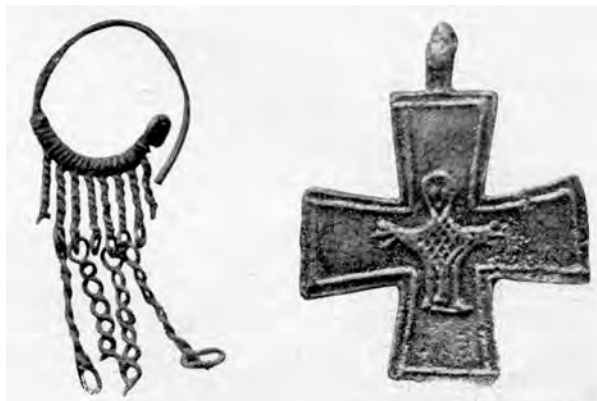
Abb. 4: Bronzering mit Anhängern und Bleikreuz aus dem 9. Jahrhundert.

Die beiden Kreuzbalken sind am Rande gerillt; im Mittelfeld ist die Darstellung des Heilandes sehr deutlich erkennbar, die Arme der Christusfigur sind ganz horizontal, Gesicht, Falten der Kleidung und Hände außerordentlich einfach und primitiv geformt, Füße nicht einmal angedeutet, als wären sie vom Kleide verdeckt. Das Kreuzchen ist 34 mm breit, 43 mm hoch und 1 mm dick.