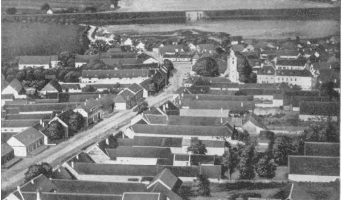
Abb. 14: Fliegeraufnahme von Bernhardsthal