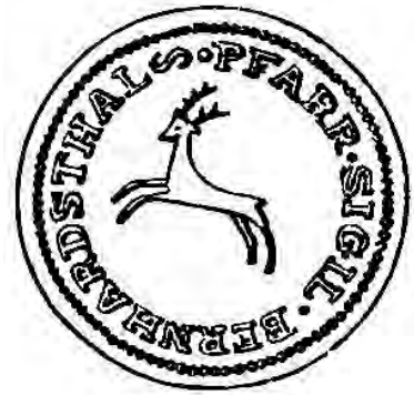
Abb. 11: Pfarrsiegel vom Jahre 1800

Zwei Jahre später erscheint auf der Fassion der Pfarre zum erstenmal das amtliche Siegel, vielleicht das erste Pfarrsiegel von Bernhardsthal überhaupt. Es ist außerordentlich einfach und nüchtern und damit in einem gewissen Gegensatz zu den meist sehr komplizierten Siegeln der Adelligen, ihrer verschiedenen Ämter, ja auch der individuellen Siegel der einfachen Bauern und Gewerbetreibenden