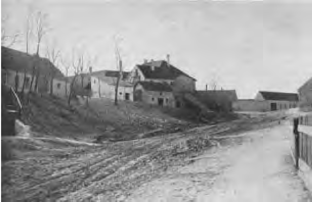
Abb. 5: Der Burghügel (in der jetzigen Form).

Schloßberg die Gegend nach Osten, nach Norden und selbst nach Westen; er ist innerhalb des engeren Ortsgebietes die höchste Erhebung; er ist durch jähren Abfall nach Norden und durch einen tiefen Einschnitt gegen Osten und Südosten ziemlich scharf vom übrigen Gelände geschieden. Es erscheint wirklich nicht wahrscheinlich, daß man an der von Natur aus für eine befestigte Anlage geeigneten Anhöhe vorbeigegangen und sich mit der Burg zum tiefer liegenden, wenig gesicherten und überdies räumlich sehr beengten Schloßberg gewendet hätte. Die letzten adeligen Besitzer von Bernhardthal waren die Fürsten Liechtenstein; sie haben offenbar die Veste geschleift oder mindestens ihren Verfall geduldet. Darauf wird noch zurückzukommen sein. Trotz aller Verschiebungen in den Besitzverhältnissen bei der Befreiung des Bauernstandes im achtzehnten und neunzehnten Jahrhundert sind die Gutsherren Eigentümer ihrer Schlösser und Burgen, jedenfalls aber der Grundparzelle geblieben,