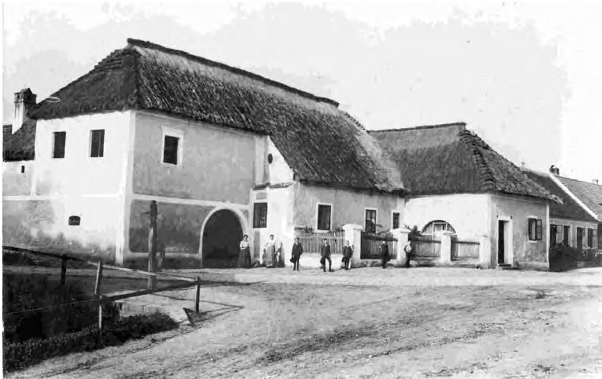
Abb. 6: Haus Nr. 104 in der alten Bedachung