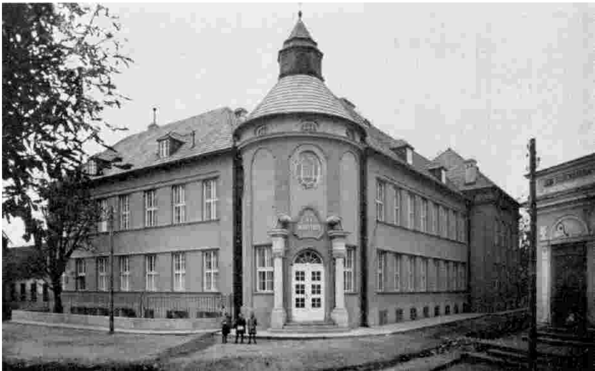
Abb. 13: Lehr- und Erziehungsanstalt „St. Martha“

nordöstlichen Winkel von Niederösterreich, in der unmittelbaren Nähe der Staatsgrenze, erhöht noch ihre Bedeutung.